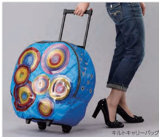
キルトキャリーバッグ