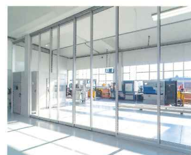
工場・オフィスなど