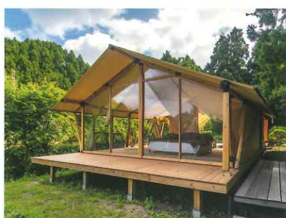
アウトドア・スポーツ施設など