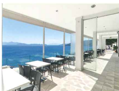
カフェ・レストランなど

■用途イメージ ※写真はあくまでもイメージです。当製品が実際に使用されている写真ではございません。